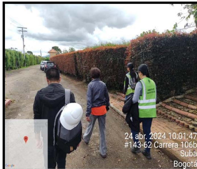
Fotografía 10. Recorrido Urbano entre el Club Laverdieri y el municipio de Cota. El día 24 de abril de 2024