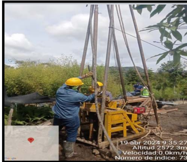
Fotografía 7. Acompañamiento interventoría a trabajos de exploración Geotecnia del día 19 de abril de 2024

Fuente: Consorcio Interventoría Cota, 2024.