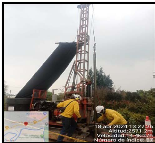
Fotografía 6. Acompañamiento interventoría a trabajos de exploración Geotecnia del día 18 de abril de 2024