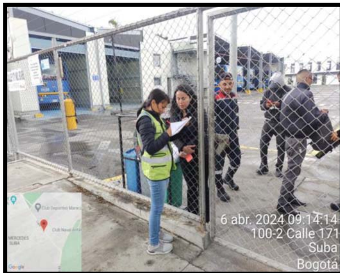
Fotografía 1. Acompañamiento en la entrega de volantes IDU el día 6 de abril de 2024 en relación con las actividades de geotecnia.