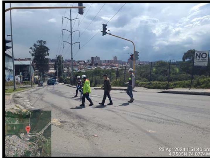
Fotografía 9. Recorrido de campo con Vanti, Consultoría e Interventoría para verificar la ubicación de la tubería de 14"