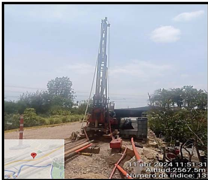
Fotografía 3. Maquina SONDEÓ 03 con la cual se realiza la perforación PB3'