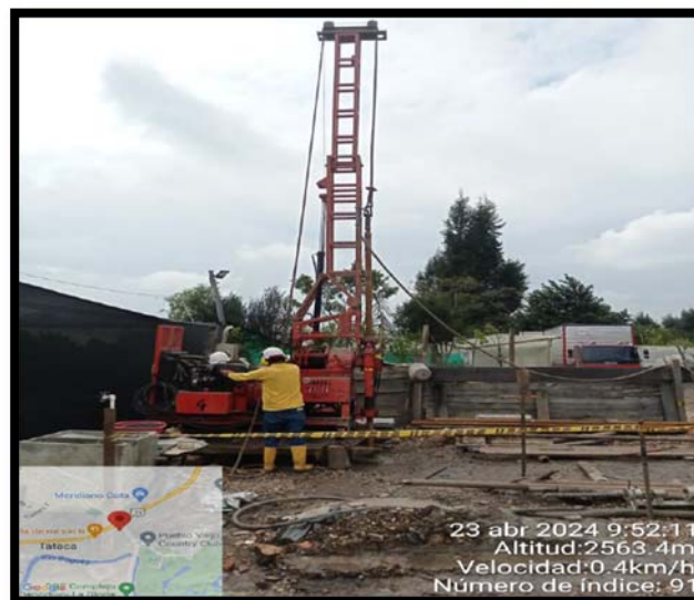
Fotografía 8. Acompañamiento Interventoría a trabajos de exploración Geotecnia del día 23 de abril de 2024