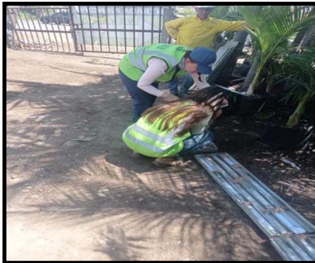
Fotografía 5. Acompañamiento consultoría e interventoría a trabajos de exploración Geotecnia del día 16 de abril de 2024