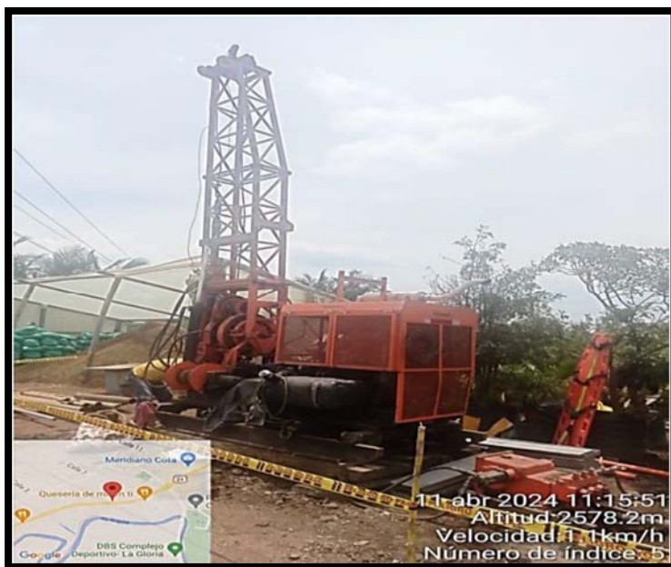
Fotografía 4. Maquina ACKER 04 con la cual se realiza la perforación PL3-2